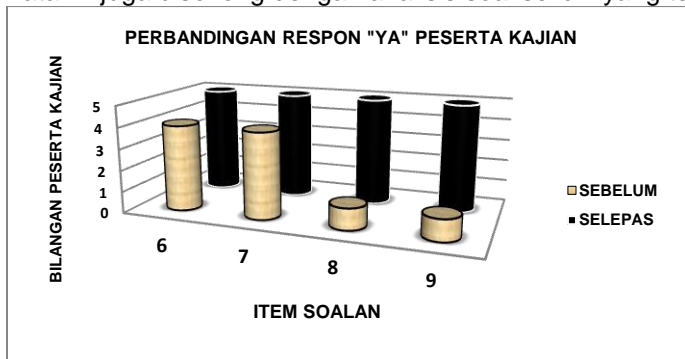
Rajah 7. Perbandingan respon 'YA' peserta kajian dalam perkembangan kemahiran mengenal pasti hukum Mad Asli

Data ini juga disokong dengan analisis soal selidik yang telah dijalankan.